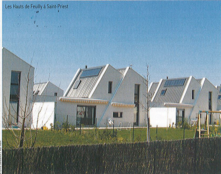
Les Hauts de Feuilly à Saint-Priest

"Il faut absolument que l'usager sache qu'il a une maison différente et qu'il doit en profiter différemment. Ce sont des maisons très confortables mais il faut savoir vivre dedans"